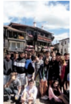
La Alberca. Plaza Mayor

Wir reisen gemeinsam in unser Nachbarland. Vormittags besichtigen wir den historischen Stadtkern, bekannt als "Venedig Portugals", um anschließend den Tag am Strand zu verbringen um Sonne und Meer zu genießen.