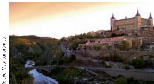
Toledo. Vista panorámica

Der Preis für die Ausflüge beträgt zwischen 40 und 50 Euro pro Person .