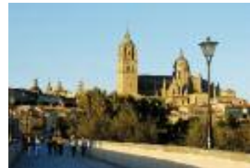
Salamanca. Puente Romano y Catedral