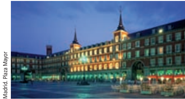
Madrid. Plaza Mayor

An den Wochenenden bieten wir Ausflüge in verschiedene Städte und Regionen Spaniens an. Weil wir bei der Organisation eng mit einem bekannten Reisebüro zusammenarbeiten und dadurch auch Studenten anderer Institutionen teilnehmen können, sind