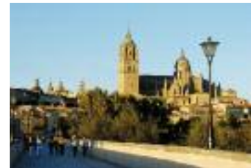
Salamanca. Puente Romano y Catedral

Rodeada de dos conocidas sierras montañosas, la Sierra de Gredos al suroeste y la Sierra de Francia al oeste, nuestra región ofrece ilimitadas posibilidades para disfrutar de la naturaleza y descubrir típicos y antiguos pueblos.