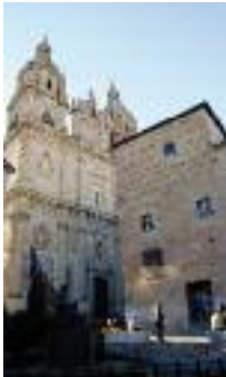
Salamanca. Casa de las Conchas

Salamanca ofrece una combinación ideal de historia, arte y ambiente estudiantil.