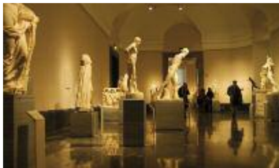
Madrid. Museo de El Prado

Las excursiones de un día se hacen en sábado y domingo. El precio de estas excursiones es de 30 a 40 euros por persona .